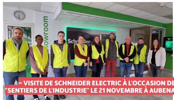
» VISITE DE SCHNEIDER ELECTRIC À L'OCCASION DES "SENTIERS DE L'INDUSTRIE" LE 21 NOVEMBRE À AUBENAS

L'objectif de la CCBA est de stimuler les projets de création d'entreprises, via des événements dynamiques sur notre territoire.