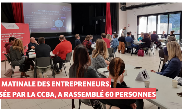
» LA 6 ÈME MATINALE DES ENTREPRENEURS, ORGANISÉE PAR LA CCBA, A RASSEMBLÉ 60 PERSONNES

Échanges, conférences, visites se sont enchaînés pour un public varié dont la vision de l'industrie a positivement évolué. 500 visiteurs dont plus de 100 élèves sont venus explorer le monde de l'industrie.