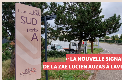
→ LA NOUVELLE SIGNALÉTIQUE DE LA ZAE LUCIEN AUZAS À LAVILLEDIEU

Par exemple, sur la commune de Lachapelle-sous-Aubenas, des travaux de mise en valeur de la ZAE Chastrenas ont démarré pour sécuriser les entrées de la zone, construire des pistes cyclables et faciliter l'accès aux entreprises et magasins de la zone, pour un montant total de 840 000 €.