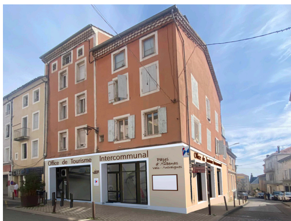
Aperçu de la façade du futur Bureau d'Information Touristique d'Aubenas, au 53 Boulevard Gambetta.

Ce nouveau local abritera également un point d'accueil et information habitat, avec des permanences qui seront organisées par les partenaires de la CCBA (Soliha 07, Alec07, etc.).