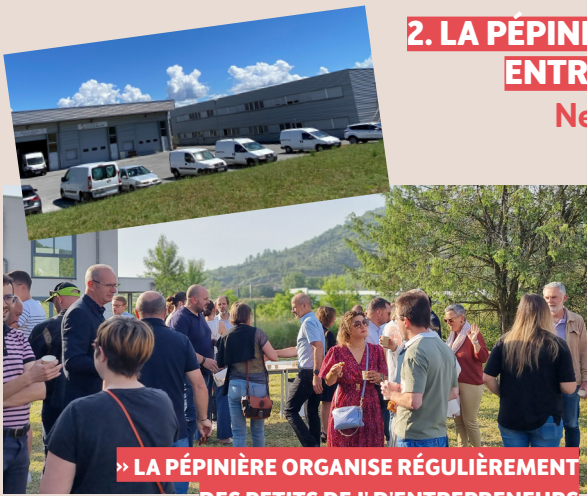
» LA PÉPINIÈRE ORGANISE RÉGULIÈREMENT DES PETITS DEJ' D'ENTREPRENEURS