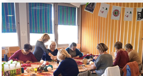
Atelier créatif au Centre Socio-Culturel Le Palabre

Pour la 9 ème année consécutive, la Semaine Bleue était de retour sur le Bassin d'Aubenas, du lundi 30 septembre au dimanche 6 octobre 2024.